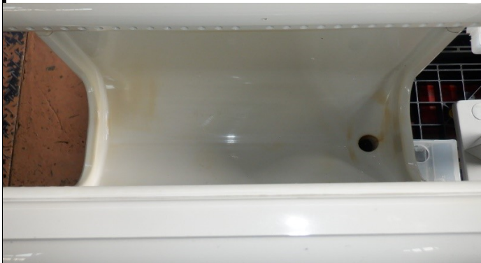
手挿入部 黄ばみがある