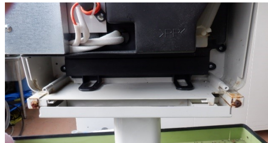
下部取付ネジの錆が有る。